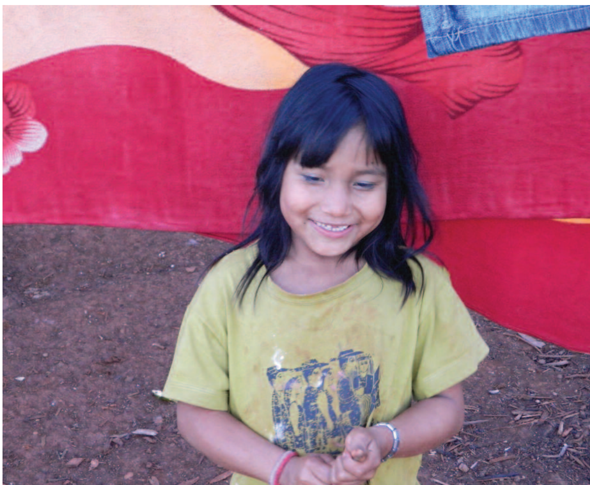
Criança Guarani-Kaiowá