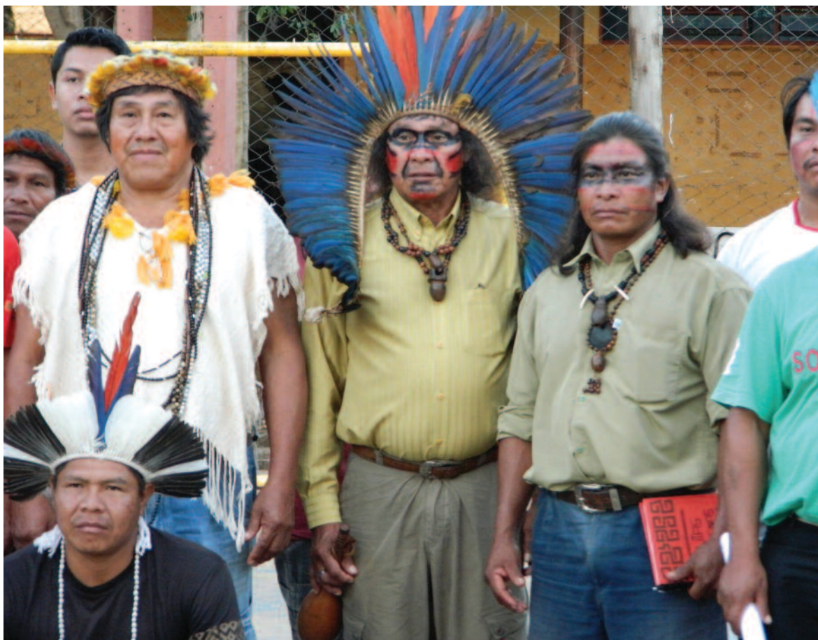
Lideranças Terenas reunidas em Assembleia

pação dos indígenas, que têm pouca ou quase nenhuma representatividade no Legislativo. De modo que seu modelo alternativo de vida está sendo desrespeitado, o que significa uma violação à Constituição.