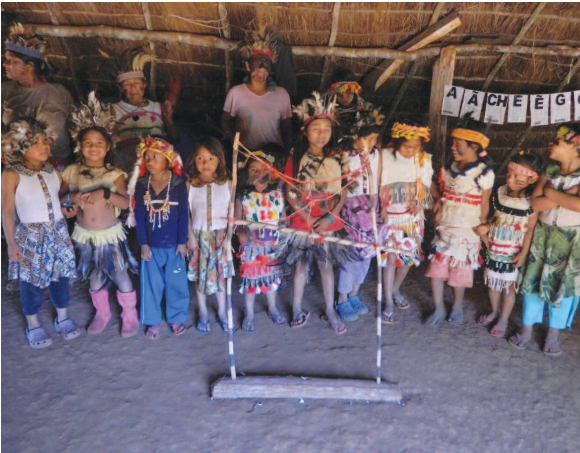
Foto: Crianças em momento de reza na Aldeia Guaiviry.

Em síntese, os acampamentos representam a pior realidade indígena no Estado, são totalmente precarizados, recebem de maneira irregular as cestas básicas, estão sem saneamento básico, acesso à água potável. E são os locais onde se encontra um grande número de crianças.