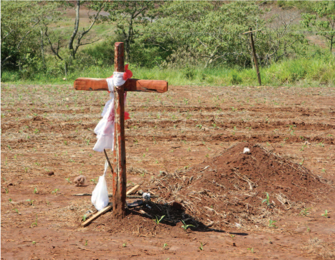
Local onde o jovem Denilson foi sepultado

Carneiro Gonçalves, que confessou o crime. Como forma de protesto, cerca de 500 indígenas acamparam na área reivindicando a Tekoha (em Guarani significa o lugar onde se é ), e enterraram seu ente assassinado no local. Desde então a área tem sido alvo de constantes incursões do fazendeiro, inclusive com denúncias de tentativas de invasão por homens armados.