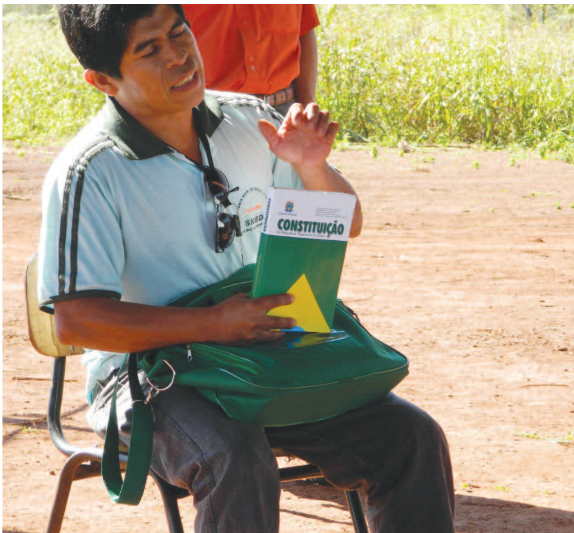
Fala de liderança Guarani na ocupação Pindo-Roky

O que marca este cenário é a morosidade dos governos nos procedimentos de identificação, delimitação, demarcação e regularização fundiária. Frisa-se aqui que do mapa pode-se observar que a imensa maioria dos territórios demarcados encontra-se na Amazônia. Diante disso, há a continuidade de uma série de violações de direitos dos povos indígenas, uma vez que o acesso aos territórios é condição primordial para o acesso a outros direitos, bem como para a concretização de uma vida digna a estes povos, visto que a produção e reprodução de seu modo de ser está intimamente ligada ao espaço da ancestralidade.