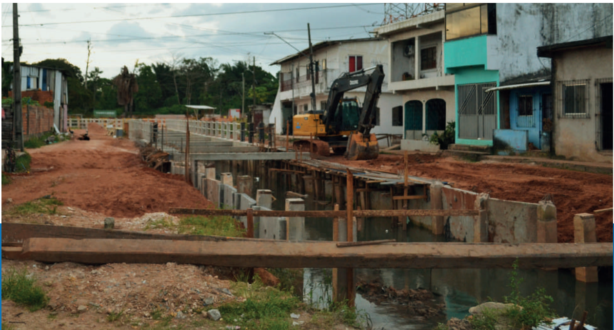
Foto: Intervenções nos territórios do Igarapé São Joaquim, julho de 2025.

Não há justiça climática possível sem justiça racial, territorial e socioambiental. As intervenções urbanas em Belém revelam uma contradição acentuada entre a retórica nacional de liderar a agenda climática desde o Sul Global pelo exemplo e a realidade local, onde a busca por uma imagem de “cidade sustentável” para o mundo se sobrepõe aos direitos básicos das populações que nela vivem.