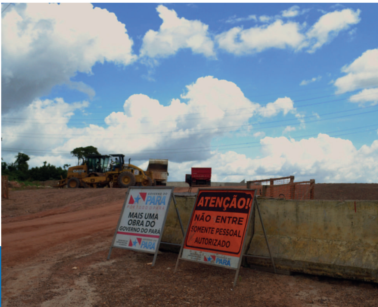
Foto: Implementação da Avenida Liberdade, margeando o território do Quilombo Abacatal, junho de 2025.

“Falamos de sustentabilidade para o mundo, mas aqui pra gente só sobra destruição. Querem mostrar uma cidade moderna, mas escondem que estão passando por cima de um Quilombo com mais de 300 anos”.