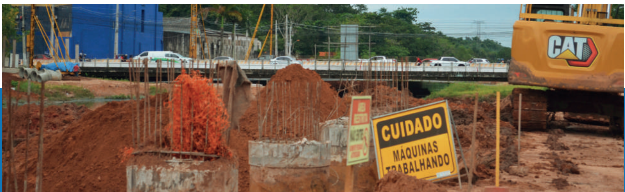
Foto: Obras nos territórios do Igarapé São Joaquim, julho de 2025.

“Não é possível falar de sustentabilidade sem incluir quem vive e protege esse território” .