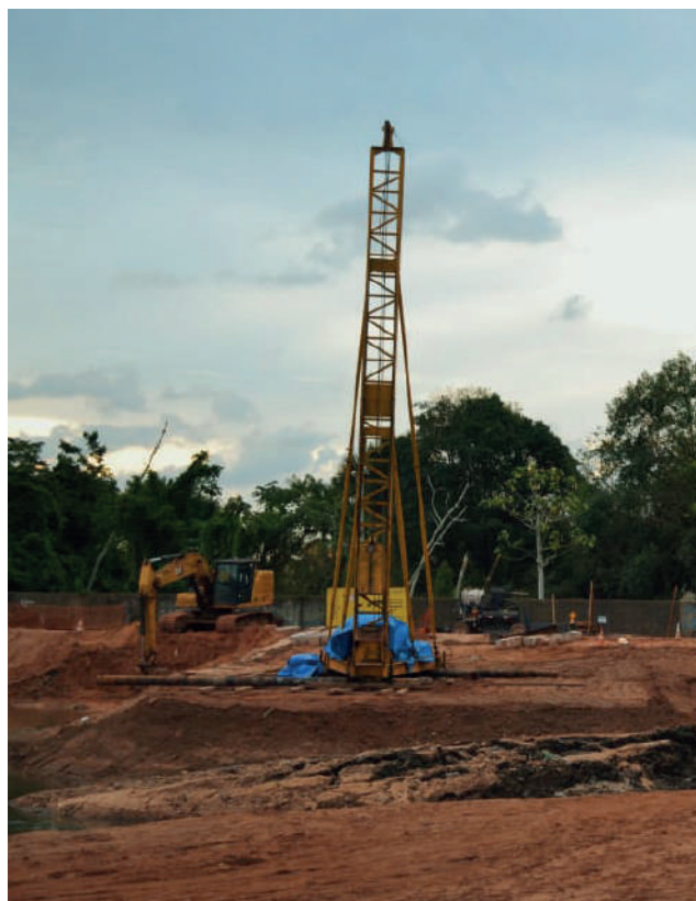
Foto: Intervenções no território do Igarapé São Joaquim, julho 2025.

de investimentos em obras de infraestrutura e “requalificação” que se restringem aos bairros nobres e às áreas turísticas. Isso é acompanhado pela especulação imobiliária desenfreada : o número de imóveis anunciados em plataformas digitais saltou de 274 em 2019 para quase 2.000 em 2025, gerando um aumento exorbitante nos preços de moradia e hospedagem. Por fim, ocorre a invisibilização das populações locais : a Amazônia é mobilizada como um símbolo global, mas suas populações, historicamente vulnerabilizadas, são sacrificadas, aprofundando as injustiças socioambiental, racial e territorial em nome de uma “vitrine internacional”.