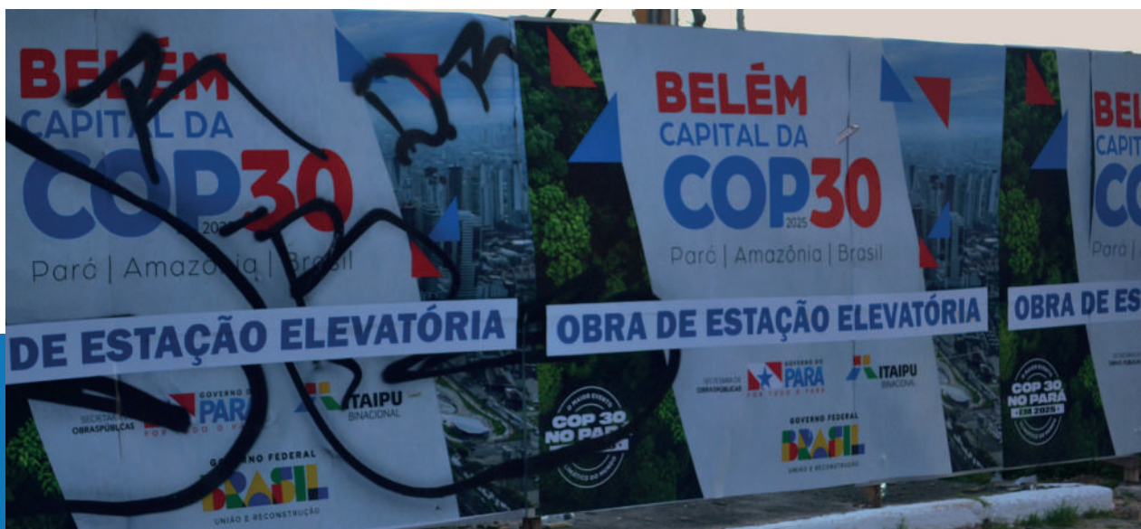
Foto: Obras da Estação Elevatória de Esgoto na Vila da Barca, julho de 2025.

“A gente escuta promessa há décadas. Começaram prédios que nunca terminaram, tiraram famílias sem dar casa, deixaram escombros no lugar. É como se quisessem que a gente desistisse de existir”.