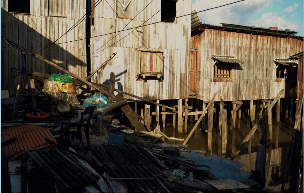
Foto: Palafitas da Vila da Barca, julho de 2025.